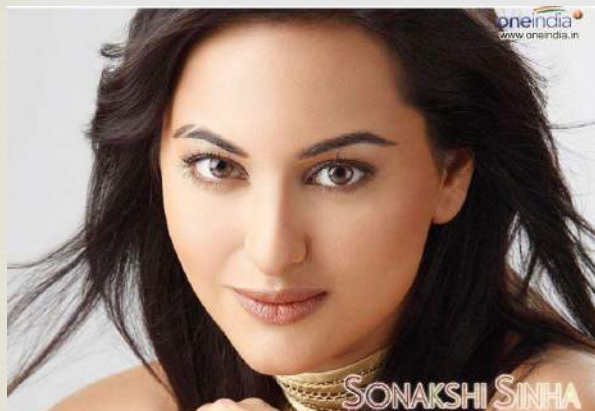
Индийская актриса Сонакши Синха бихарской национальности