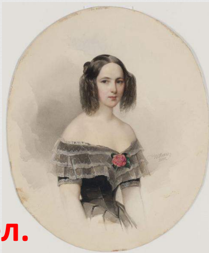
Русская красавица XIX в. Наталья Гончарова