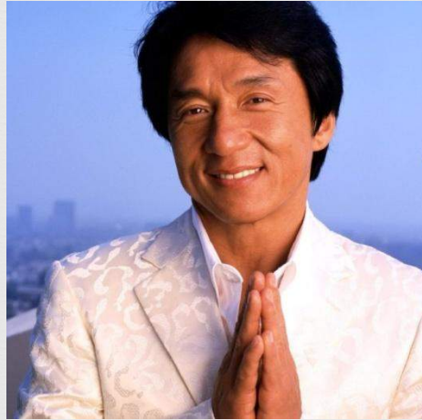
Китайский актёр и режиссёр Джеки Чан