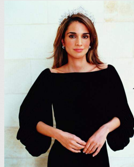
Актёр Омар Шариф