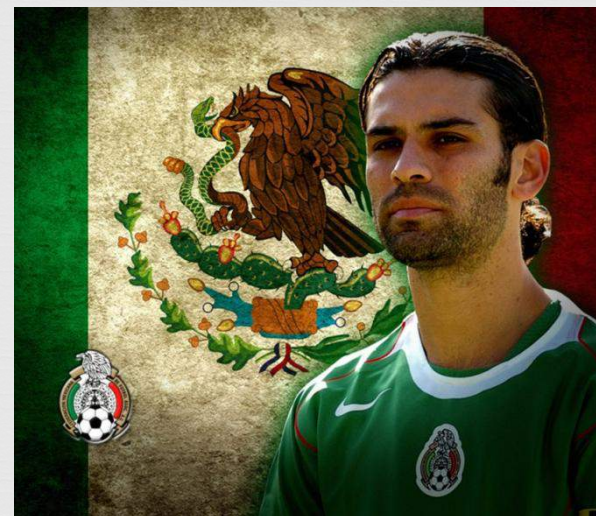
Мексиканский футболист Рафаэль Маркес