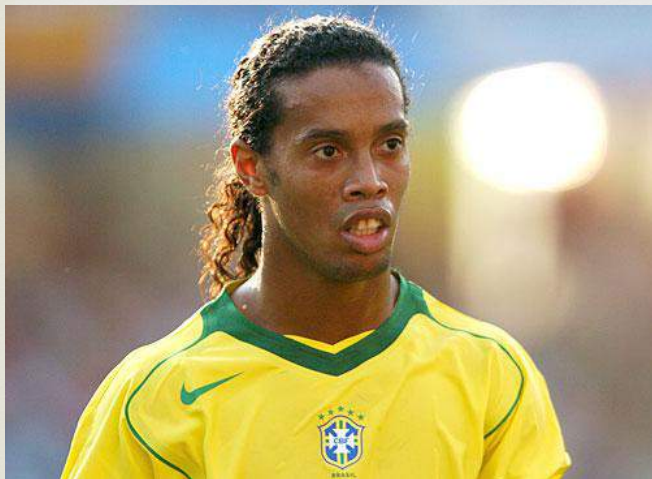
Бразильский футболист Роналдиньо