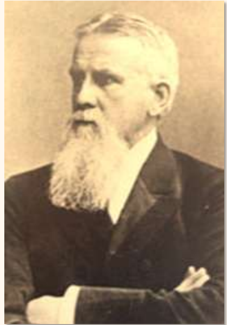
Фридрих Ратцель (1844-1905)

Предпринял попытку нарисовать общую картину расселения человечества по земной поверхности и показать связь развития культуры с географическими условиями