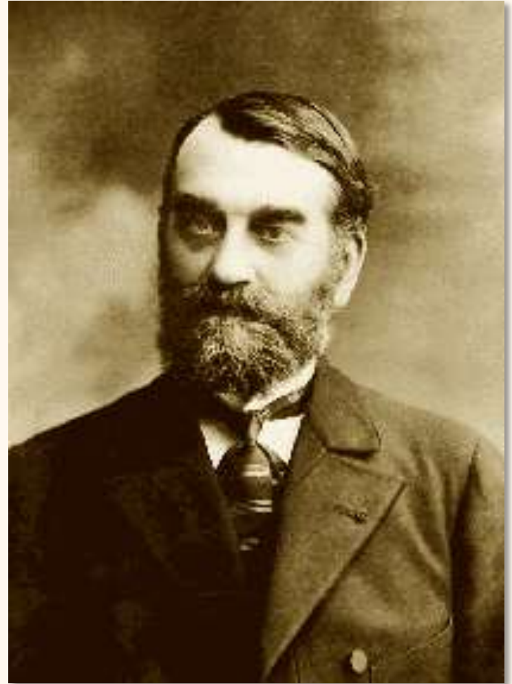
Поль Видаль де ла Бланш (1845-1918)

«Задача географии заключается в том, чтобы выяснить, каким образом физические и биологические законы, управляющие миром, сочетаются и изменяются на различных участках поверхности Земли»