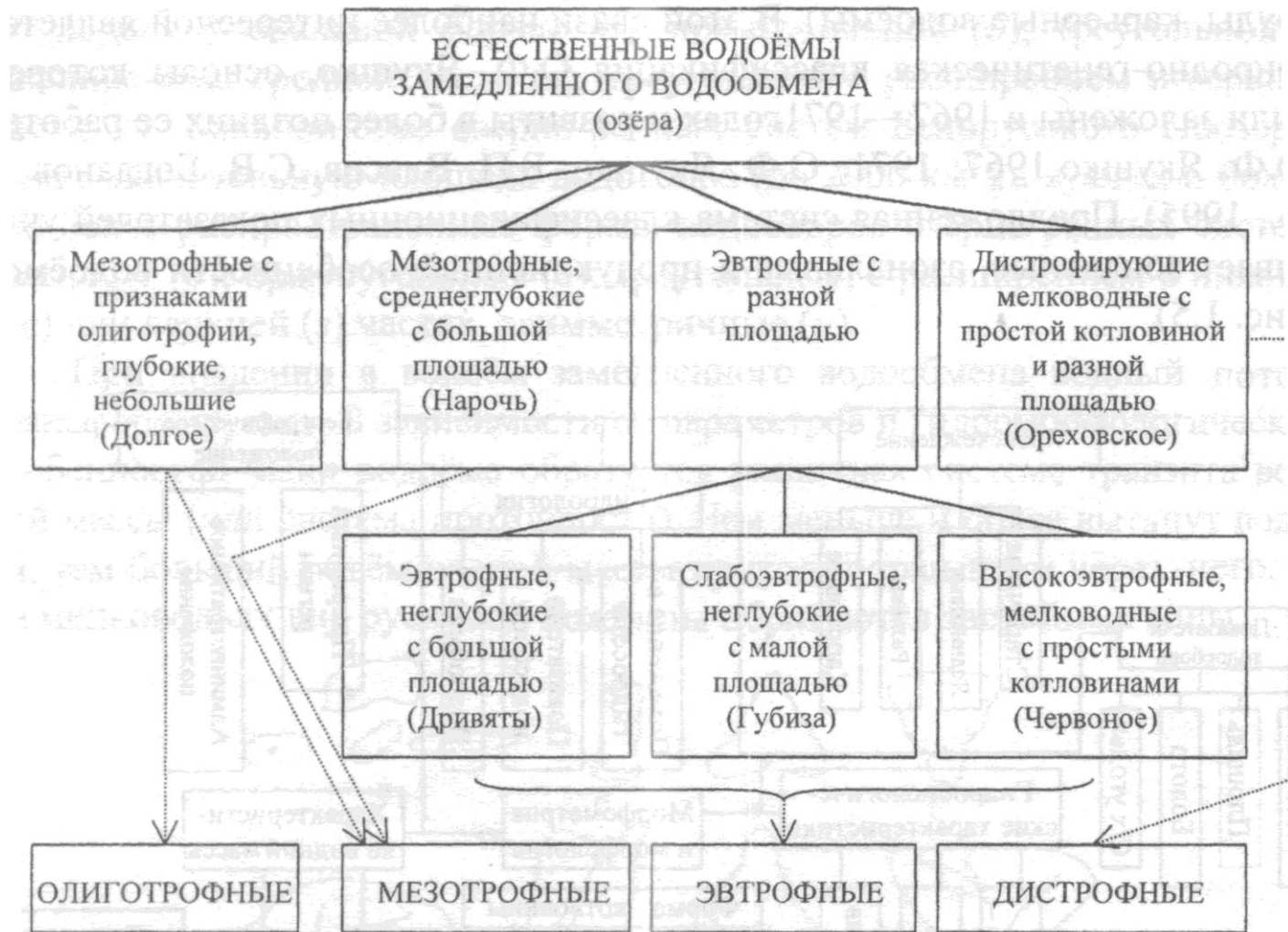
Рис. 10.4. Природно-генетическая классификация озер Беларуси и их соотношение с эволюционным генетическим рядом уровней трофии