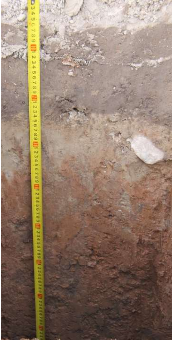
Тип дерново-подзолистых почв (Браславский стационар, неэродированная, 2014 г.)