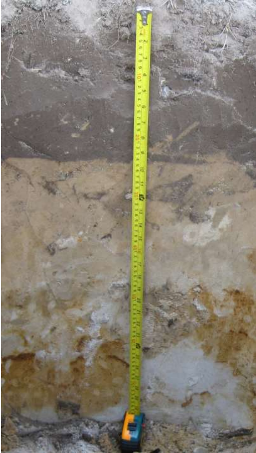
Тип дерново-карбонатных почв (Гомельский район, 2014 г.)