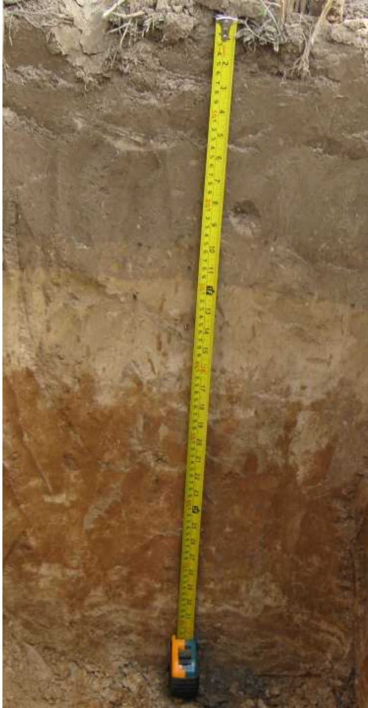
Тип дерново-подзолистых заболоченных почв (Бобруйский район, 2014 г.)