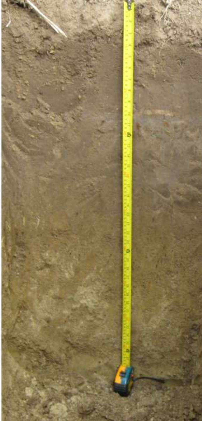
Тип дерново-карбонатных почв (Туровский район, д. Черничи, 2014 г.)