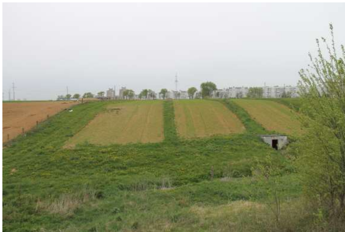
Тип дерново-подзолистых почв (Стационар «Стоковые площадки», незеродированная, 2014 г.)